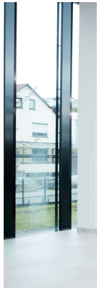
Top-Empfang bei weniger Funkstrahlung

Ein weiterer großer Vorteil von UNIGLAS® 5G: Die Technologie hilft, Elektrosmog im Gebäudeinneren zu reduzieren. Da die Beschichtung hohe Transmissionswerte gewährleistet, müssen Smartphones und Tablets ihre Sendeleistung in deutlich geringerem Maße erhöhen, um Daten zu empfangen. Die Reduzierung der Ausgangsleistung und des Energieverbrauchs schont zudem den Akku, was nicht zuletzt auch einer längeren Lebensdauer der Mobilfunkgeräte zugute kommt.