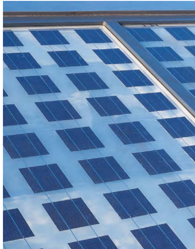
Maximale Flächennutzung von Photovoltaik-Gläsern