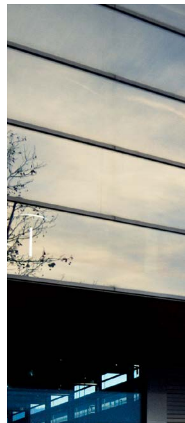
Schlanke Profile erzeugen Sprossenoptik

Egal ob Monoscheibe oder Isolierglasverbund: GM SOLAR hält zuverlässig alle Glasarten und -stärken. Erhältlich ist das Haltesystem im Lagermaß von 6.000 mm oder auf Fixmaß zugeschnitten.