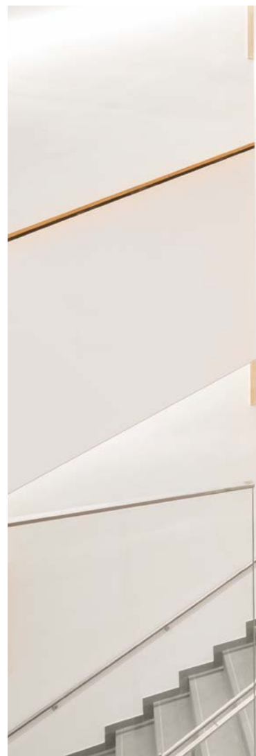
Hingucker: T-Shirts hinter Glas