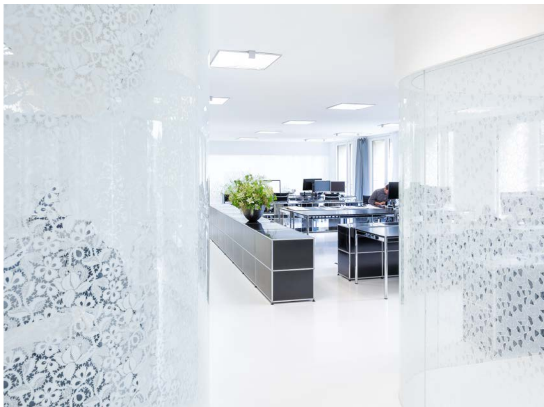
Feinste Spitze im Glas adelt jeden Raum.